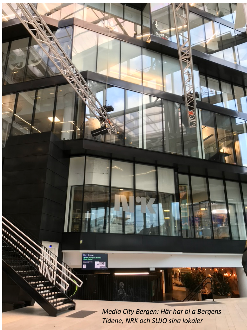
Media City Bergen: Här har bl a Bergens Tidene, NRK och SUJO sina lokaler

Av Christoph Andersson, författare, journalist och högskolelärare