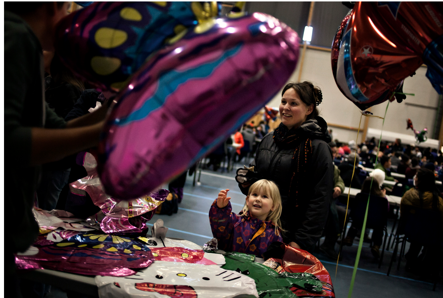
Det virker, som om hele Nuuk er samlet i den store sportshal, som tivoliet har indtaget denne weekend. Sidste uge blev det aflyst på grund af blæst og regn. Forlystelserne er de samme, som for 20 år siden, men det mærker man ikke på de mange glade børn.